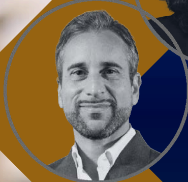
Dir. Fabrizio Sintucci